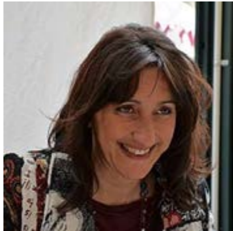
Candidata al Senato 49 ANNI Liguria 1

Funzionario tributario Agenzia delle Entrate- Verificatore fiscal, mamma di due splendide ragazze.