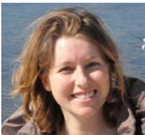
Candidata alla Camera 38 ANNI Liguria 2 - Savona

Livornese di nascita e pisana d'adozione, laureata in Medicina e Chirurgia con 110 e lode all'Università di Pisa, è specializzata in Neurologia. Attualmente è dirigente medico presso l'Asl 1 imperiese e parla correntemente inglese e francese.