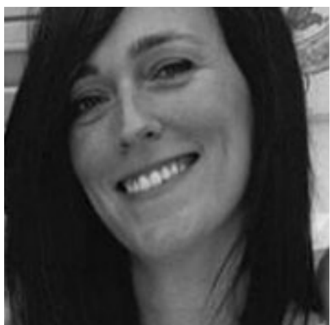
Candidata alla Camera 36 ANNI Liguria - Collegio 2

Ho 36 anni, sono avvocato del Foro di Genova, mi sono specializzata in diritto dell'ambiente e mi occupo prevalentemente di tutela della salute.