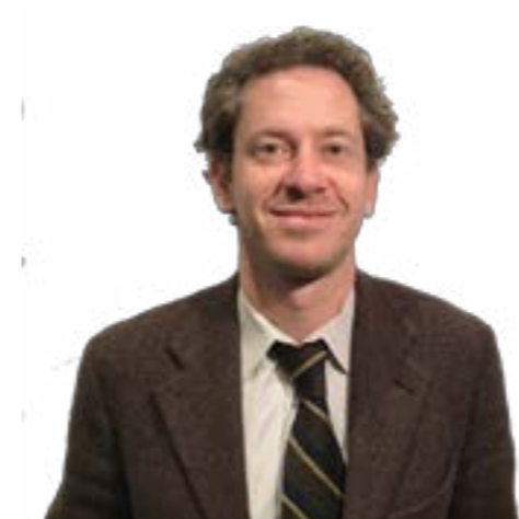
Candidato al Senato 42 ANNI Liguria 2

Avvocato specializzato in diritto amministrativo, diritto civile, difesa innanzi alla Corte dei Conti, nonché nella consulenza ad enti locali e società partecipate in materia di appalti, trasparenza e anticorruzione.