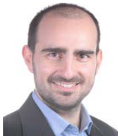
Candidato alla Camera 34 ANNI Liguria 4 - GE Bargagli

Giovane imprenditore e innovatore del mondo digital, laureato con lode in Economia e Commercio e Mercati Finanziari all'Università Sant'Anna di Pisa, grazie a una borsa di Dottorato in Management dell'Innovazione ha avuto l'opportunità di fare diverse esperienze all'estero: dalla Cina alla Silicon Valley. Nel 2011 torna in Italia, dove fonda insieme ad altri due ragazzi ZonzoFox, pluripremiata startup che punta a unire turismo e tecnologia per promuovere il territorio italiano e le sue tipicità.