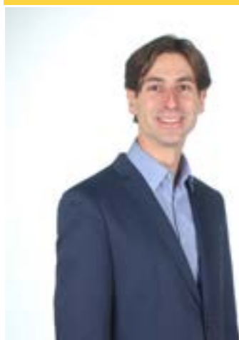
Candidato alla Camera 36 ANNI Liguria 1 - Sanremo

È docente di scienze politiche e geopolitica presso l'Istituto di Studi Politici di Parigi (Sciences Po) e all'Università di Parigi VII-Diderot. Si è laureato in scienze politiche all'Hunter College di New York e ha conseguito due Master, in scienze politiche alla City University of New York e in politiche pubbliche ad Harvard.