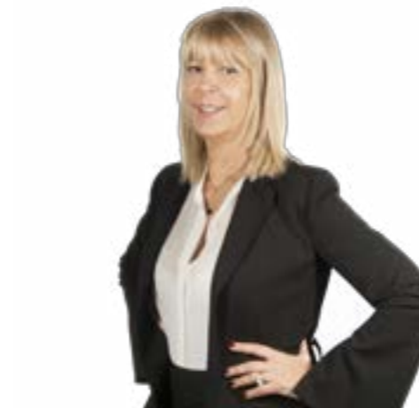
Candidata al Senato 58 ANNI Liguria 3

Svolge la professione di avvocato cassazionista da oltre 20 anni su tutto il territorio nazionale. Ha costituito un'associazione dei consumatori per consentire alla classe meno abbiente di poter fruire gratuitamente di consulenze legali. Nel 2013 ha ricevuto un'onorificenza da parte dell'allora Presidente della Repubblica Giorgio Napolitano per meriti civili.