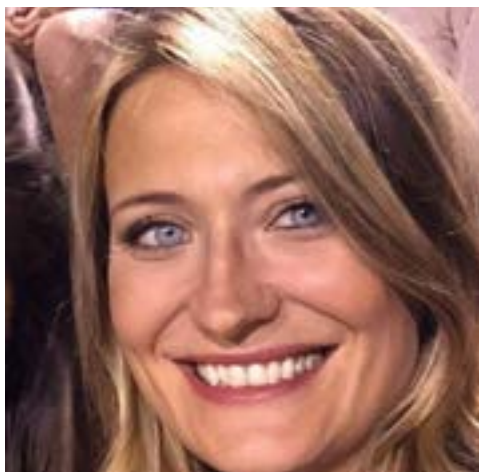
Candidata al Senato 43 ANNI Liguria 1

Ha lavorato a lungo sia nel settore immobiliare, sia in quello della comunicazione online e social. Assistente parlamentare fino alla sua candidatura, è stata social media manager dapprima in Regione Liguria e poi per singoli parlamentari, sempre per il Movimento 5 Stelle.