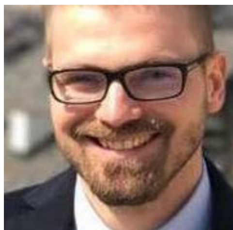
Candidato alla Camera 31 ANNI Liguria - Collegio 2

Inizia a militare nel Meetup di Savona nel 2010 partecipando a molte iniziative. Nel 2011 si candida a consigliere nel comune di Savona senza risultare eletto. Nel 2012 si candida alle parlamentarie del Movimento 5 Stelle finendo in lista nella circoscrizione Liguria per la Camera dei Deputati alle Elezioni politiche 2013. Risulta eletto Deputato della Repubblica Italiana assieme a Matteo Mantero e Sergio Battelli.