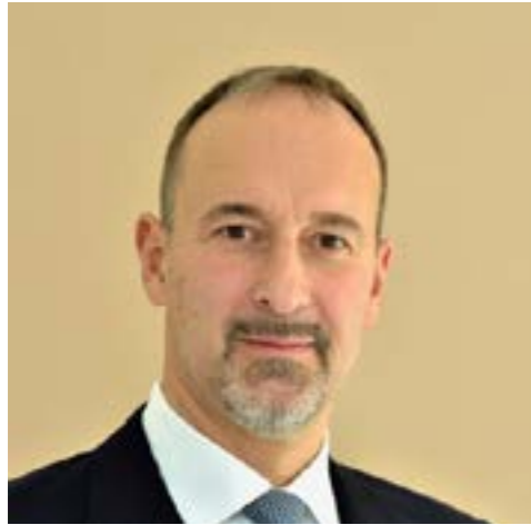
Candidato al Senato 48 ANNI Liguria 1

Manager ed imprenditore, prima per un'azienda inglese poi per una francese. 20 anni fa ho aperto la mia prima azienda: specializzata in marketing, comunicazione e loyalty. All'inizio del 2017 ho fondato una società che affitta appartamenti per soggiorni brevi a turisti e visitatori.