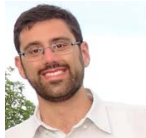
Candidato alla Camera 29 ANNI Liguria - Collegio 1