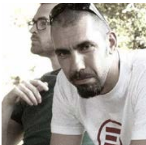
Candidato al Senato 43 ANNI Liguria 1

Si trasferisce da giovane a Savona dove prende il diploma all'ITIS come perito chimico industriale con il voto di 50/60. Frequenta l'università di Genova sostenendo 19 dei 26 esami previsti dal piano di studi non arrivando a conseguire la laurea.