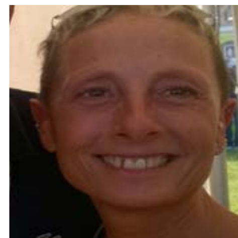
Candidata alla Camera 34 ANNI Liguria - Collegio 2

Assistente sociale per disabili ed anziani, attivista storica del Movimento 5 Stelle di Savona dal 2010, ha collaborato per la campagna delle Europee del 2013. Candidata al consiglio comunale di Savona nel 2016.